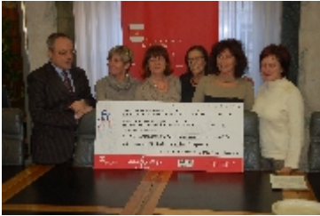
Gioco di squadra per una nobile causa